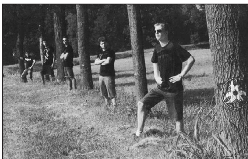
Blackmail of Murder.