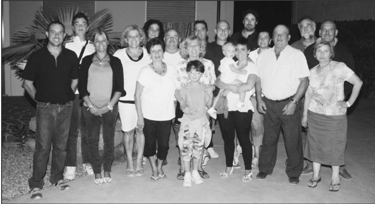
La famiglia Chiari al gran completo.