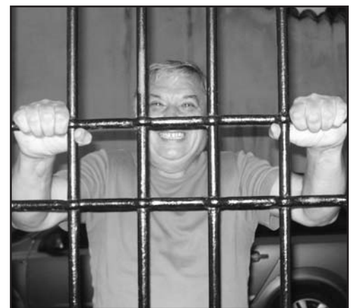
del 13 settembre 2013.

Dall'espressione del suo viso non sembra proprio gradire la situazione. Di che cosa è accusato? Indagini in corso; vi terremo informati.