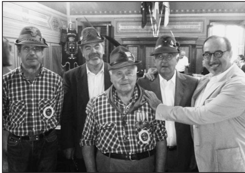
La delegazione che ha partecipato alla manifestazione.

Il raduno è stata l'occasione per ricordare la figura di Agostino Bianchi e suggellare un sodalizio tra l'associazione Alpini di Vicchio e quel-