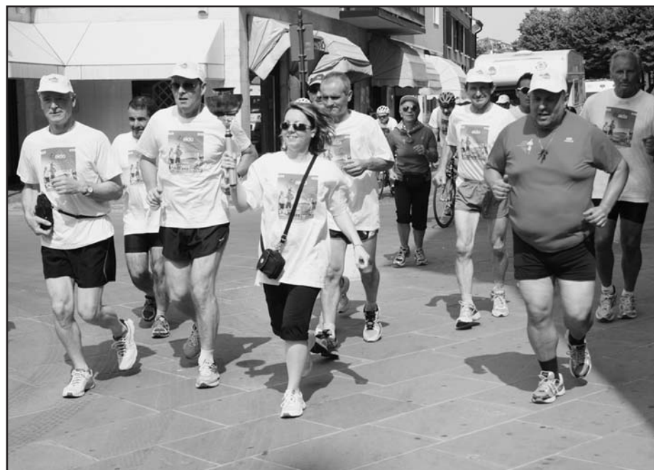
Alcuni componenti del Gruppo Podistico Avis Montichiari.