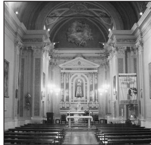
L'interno della Chiesa di Borgosotto.

A rafforzare questa devozione e a fronte del fatto che la stessa chiesa è diventata parrocchiale fin dal 1969, si è sentita l'esigenza e l'opportunità di celebrare solennemente la "Dedicazione della chiesa alla Beata Vergine di Loreto".